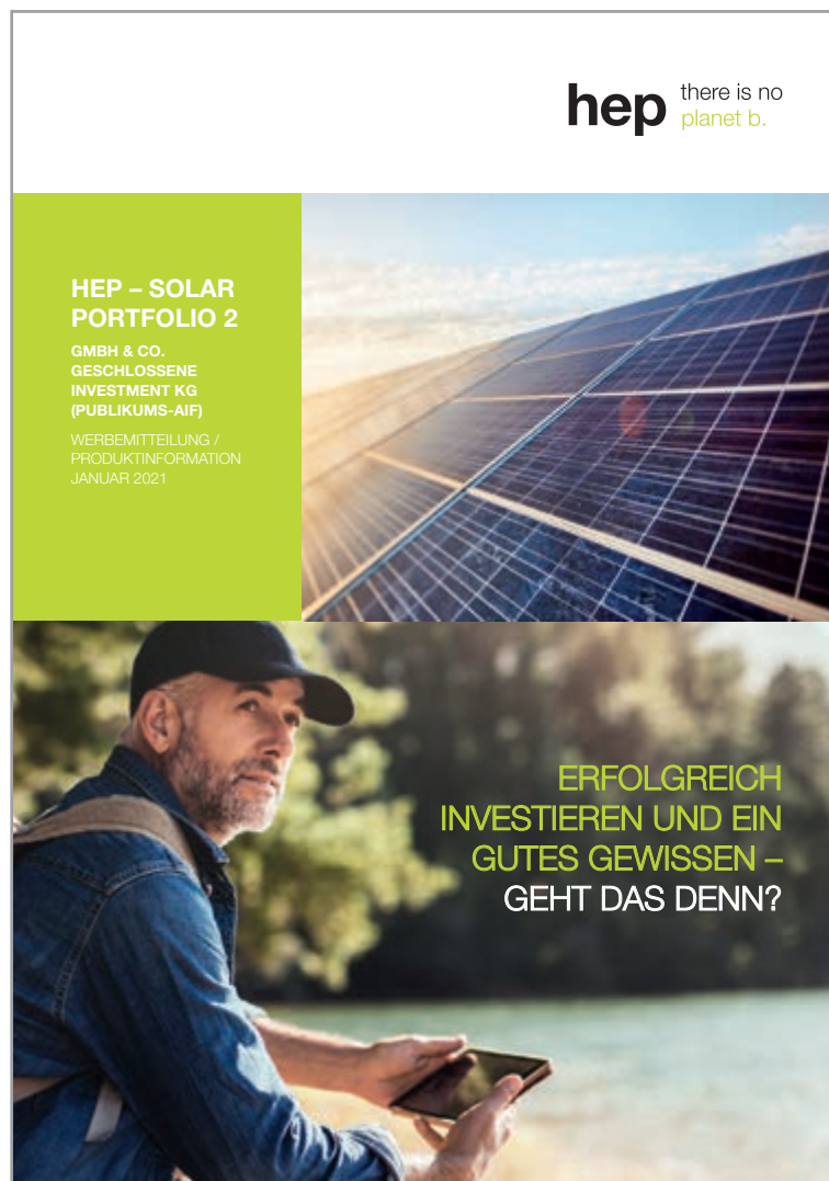
Abbildung: Titelseite der Produktinformation (Werbemittelteilung)